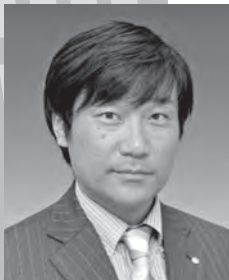
税理士法人アンシア 代表税理士