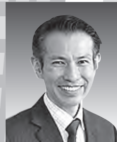
税理士法人アンシア 元国税調査官